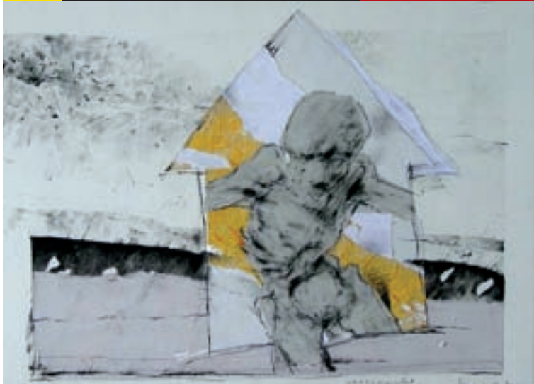
Volt egyszer egy tárlat